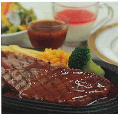
グリルステーキランチ 週替わりソース 和風・シャリアピン・赤ワイン