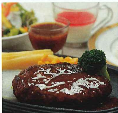
グリルハンバーグランチ 週替わりソース 和風・シャリアピン・赤ワイン