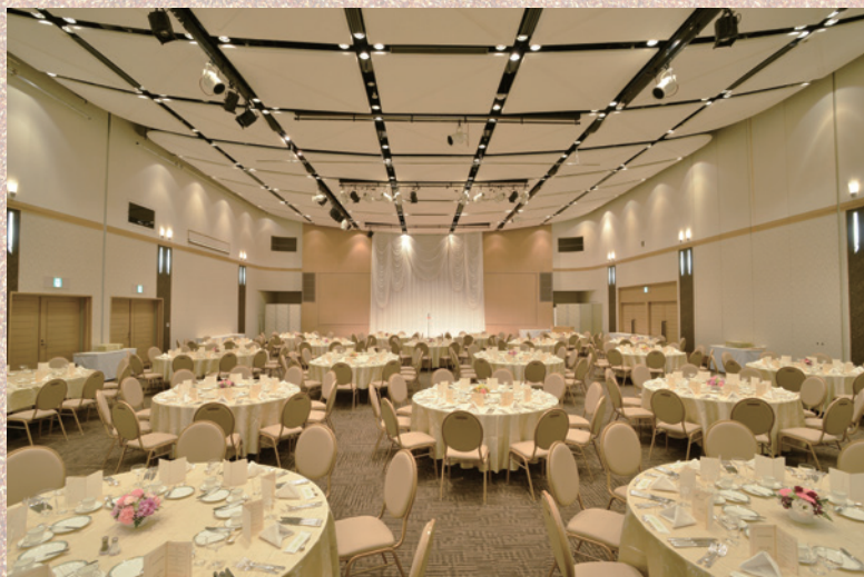
「KSP HALL」 460㎡ 着席数 250席