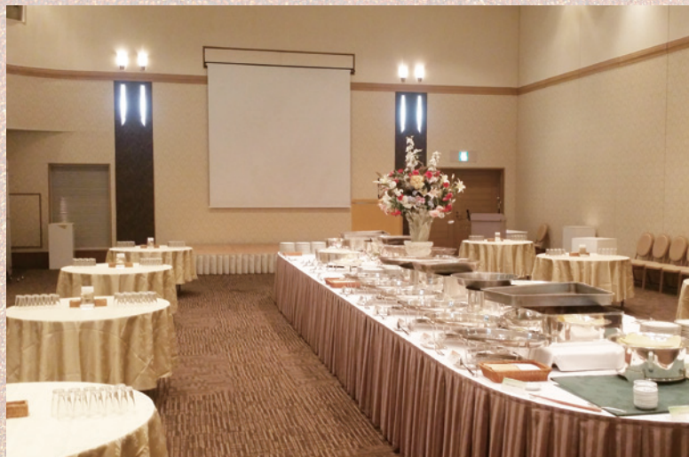
「KSP HALL 1/2 SPACE」 230㎡ 着席数 100席