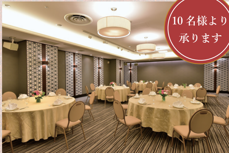
「ICHOU」 150㎡ 着席数 60席